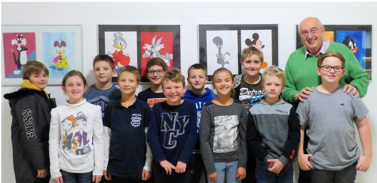
Hier die Gruppe der „Fortgeschrittenen“ im Spieljahr 2018/19

Im Folgenden sind alle Tätigkeiten aufgelistet.