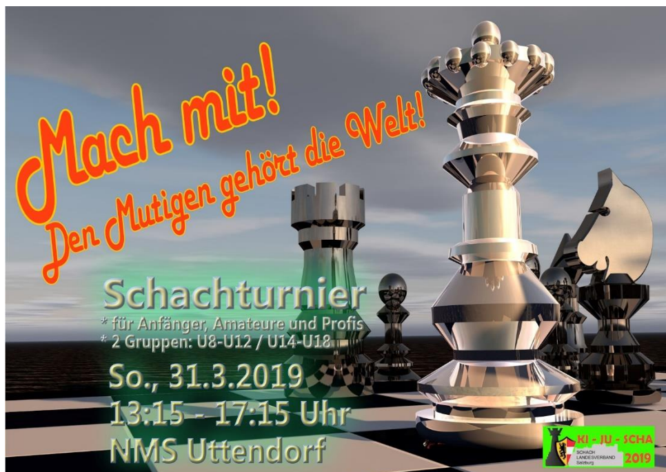
Die Einladung für das Uttendorfer Turnier