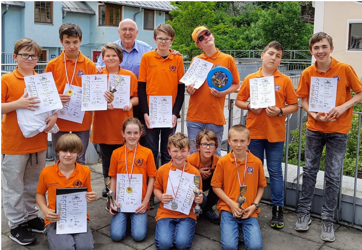
Unsere Jugendlichen, die beim Finale in Hallein dabei waren